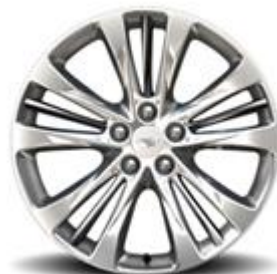
20" x 8,5" алуминиеви джанти с разделени в 5 групи спици с Manoogian Silver и 5 хромирани добавки