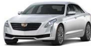
Crystal White Tricoat