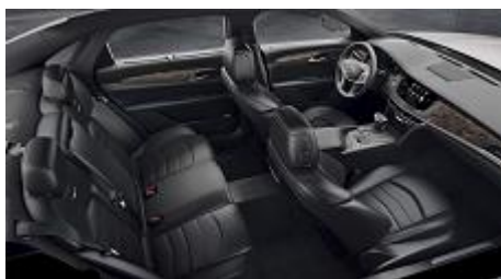
„Jet Black” кожени седалки, перфорирани, с „Jet Black” акценти на таблото и полиран „Mineral Poplar Burl” дървен интериор бронзов карбон