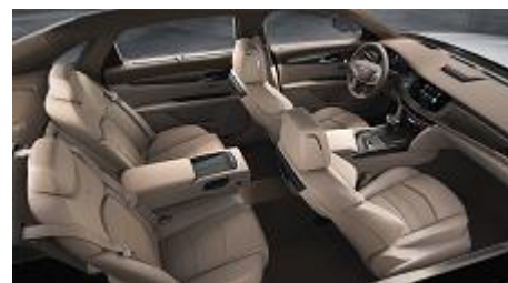
„Light Cashmere” кожени седалки, перфорирани, с „Maple Sugar” акценти на таблото и полиран „Cafe Noir” дървен интериор „Cafe au Lait” дървен интериор