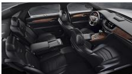
„Jet Black” кожени седалки, перфорирани, с „Jet Black” акценти на таблото и полиран Choco Noir дървен интериор с карбон