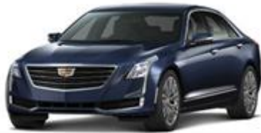
Dark Adriatic Blue Metallic