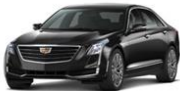
Stellar Black Metallic