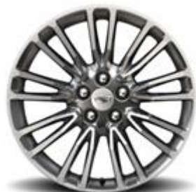
20" x 8.5" ультра-светли, алуминиеви, полирани, многоспицови джанти с Manoogian Silver джобове