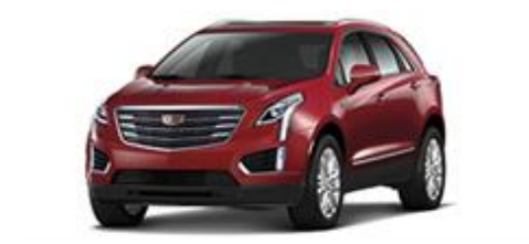
Red Passion Tincoat