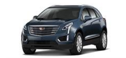
Harbor Blue Metallic