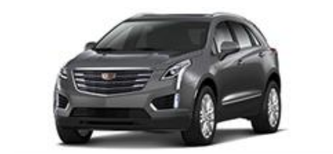
Dark Granite Metallic