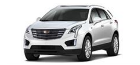
Crystal White Tricoat