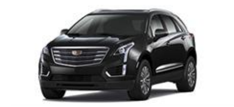
Stellar Black Metallic