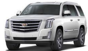
Crystal White Tricoat