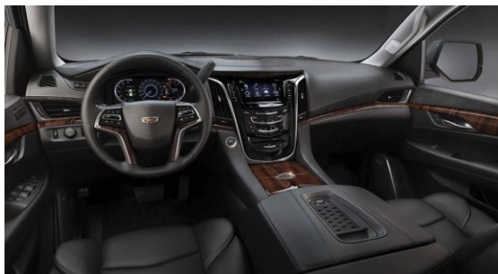
„Jet Black Mulan“ кожени седалки с „Jet Black“ акценти на арматурното табло и „Santos Palisander“ дървен интериор