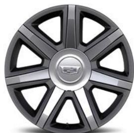
22" 7-спици, „premium-painted“ джанти с хромни вложки