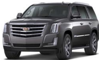
Dark Granite Metallic