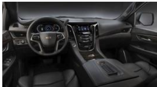
„Jet Black Opus“ кожени седалки със „Sumi Black Тамо Ash“ дървен интериор и кожен таван