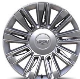
22" 9-спици, „premium-painted“ джанти с хромни вложки