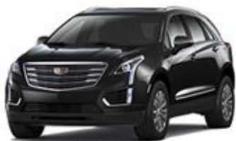
Stellar Black Metallic