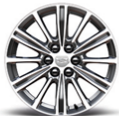
18" светли, полирани, алуминиеви джанти с акценти „Light Argent”