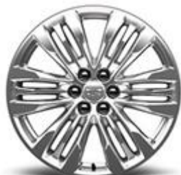
20" алуминиеви джанти с Premium боя „Sterling Silver”