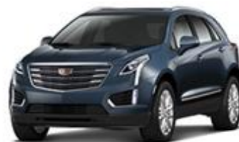
Harbor Blue Metallic