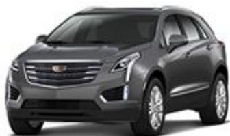
Dark Granite Metallic