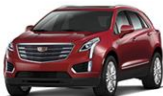
Red Passion Tincoat