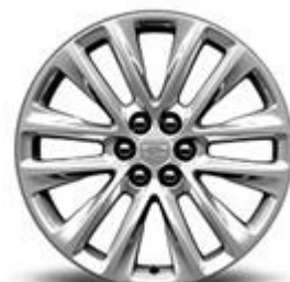
20" полирани алуминиеви джанти с 12-спицов дизайн