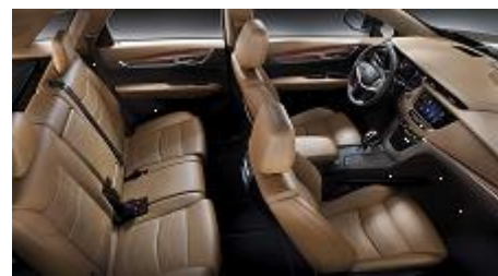
„Maple Sugar Opus” кожени седалки, перфорирани, с „Jet Black” акценти на таблото, кожен таван и „Satin Rosewood” интериор