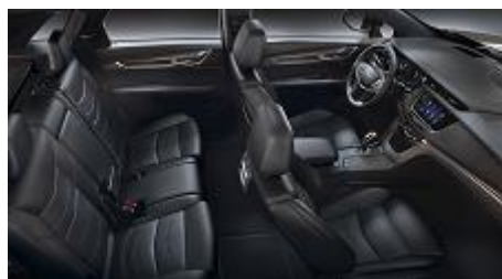
„Jet Black Opus” кожени седалки, перфорирани, с „Jet Black” акценти на таблото, кожен таван и интериор „Бронзов карбон”