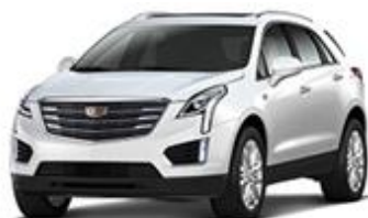
Crystal White Tricoat