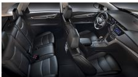
„Jet Black Mulan” кожени седалки, перфорирани, с „Jet Black” акценти на таблото и „Lunar brushed” алуминиев интериор